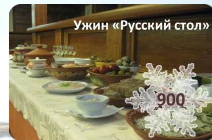
Ужин «Русский стол»